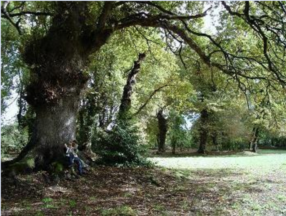
Carballa da Rocha. Declarado Monumento Natural.

O deporte de orientación se practica en silencio e de xeito individual, cun respecto máximo polo medio natural.