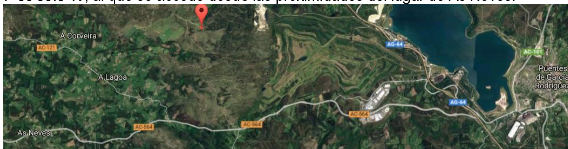
Curro de Forgoselo GPS 43°28'03.7"N 7°59'59.5"W

Curro de Forgoselo. Como en anteriores ocasiones, la zona de concentración se encuentra en el Curro de Forgoselo (A Capela). Coordenadas GPS 43°28'03.7"N 7°59'59.5"W, al que se accede desde las proximidades del lugar de As Neves.