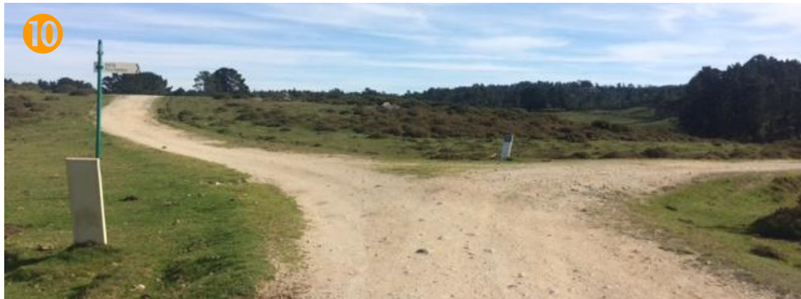
10 ← IZDA en pista de tierra que nos lleva hacia el recinto vallado del Curro de Forgoselo