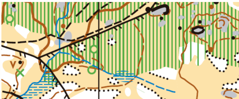
Detalle de mapa antiguo utilizado en última prueba de liga (año 2015)

Mapa nuevo realizado en 2017 por Iván Mera (mapeO) según normativa ISOM2000