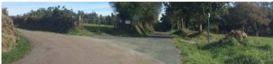
Tercero de tres cruces consecutivos 6 ← IZDA en cruce, continuando por la carretera principal.