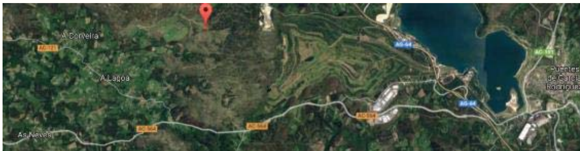
Curro de Forgoselo GPS 43°28'03.7"N 7°59'59.5"W

Curro de Forgoselo. Como en anteriores ocasiones, la zona de concentración se encuentra en el Curro de Forgoselo (A Capela). Coordenadas GPS 43°28'03.7"N 7°59'59.5"W, al que se accede desde las proximidades del lugar de As Neves.