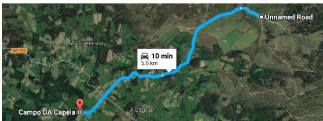
Campo de Fútbol de Os Calzados 43°27'06.3"N 8°03'05.8"W