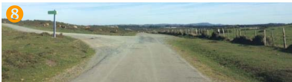
8 ↑ Seguimos RECTO en zona alta de Monte Forgoselo