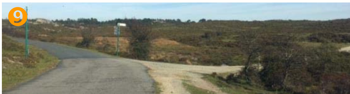
9 → DCHA. tomamos la pista de tierra de acceso al Curro de Forgoselo (tramo de 1 km)