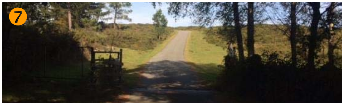
7 ↑ Seguimos RECTO en barrera canadiense, puerta de acceso a Monte Forgoselo