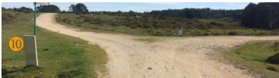
10 ← IZDA en pista de tierra que nos lleva hacia el recinto vallado del Curro de Forgoselo