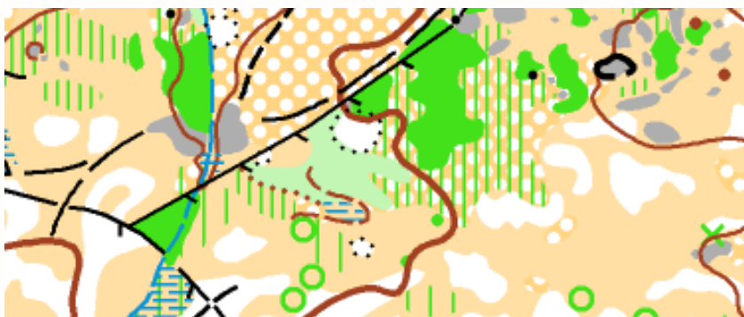
Detalle de mapa nuevo (Iván Mera, 2017)

Prohibición de acceso a mapa. Se recuerda que está prohibido el acceso al terreno de competición desde el momento en que se ha declarado la utilización del mapa de Forgoselo (artículo 17.2 del Reglamento de Orientación FEGADO).