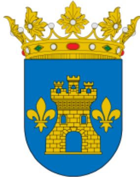
Concello de ABADÍN