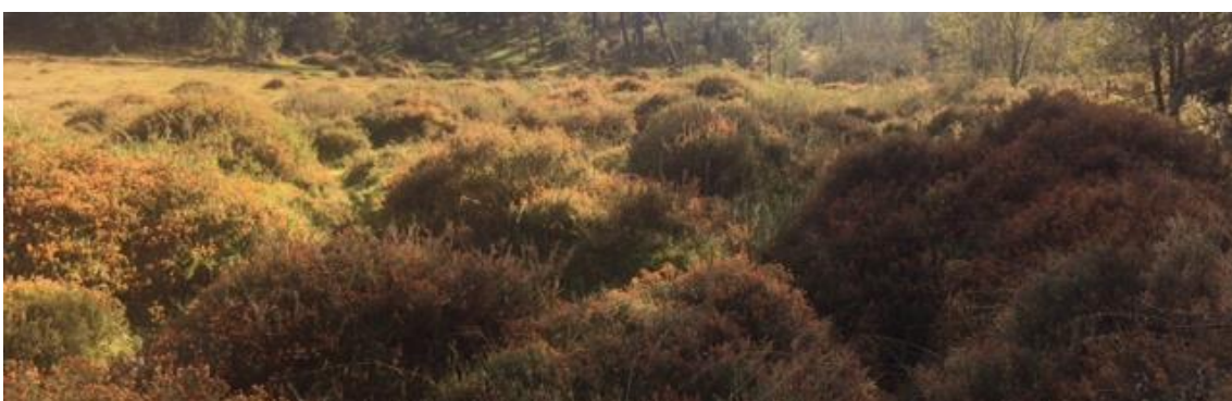
Aspecto actual de ZONAS DE EXCLUSIÓN