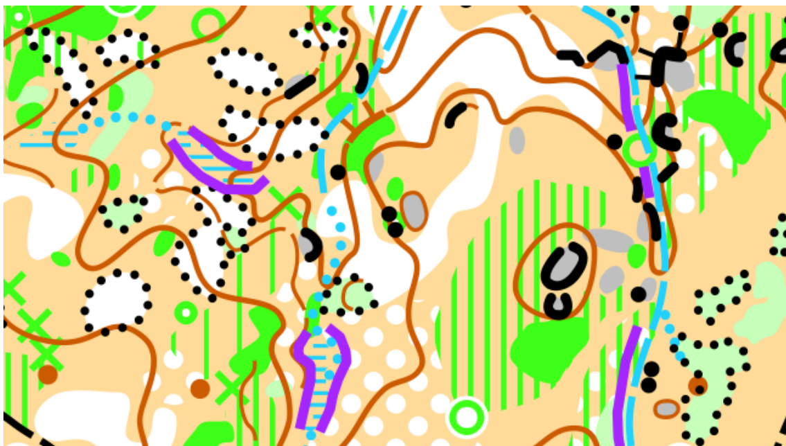
Representación de ZONAS DE EXCLUSIÓN sobre el mapa. Símbolo 708 ISOM 2017-2: paso prohibido Nota: por legibilidad de aplica un grosor de línea menor 709.4 de Purple Pen

IOC Puntos de paso habilitados. Se ofrecerán alternativas para evitar las zonas más sensibles mediante puntos de paso. Para facilitar la lectura del mapa estarán representados en color magenta con el símbolo 710 )( punto de paso o cruce.