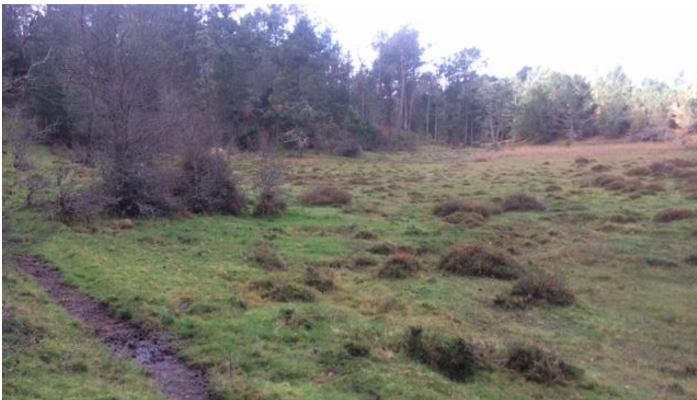
Senderos existentes, no representados en mapa, y que evitan la afección de aguas