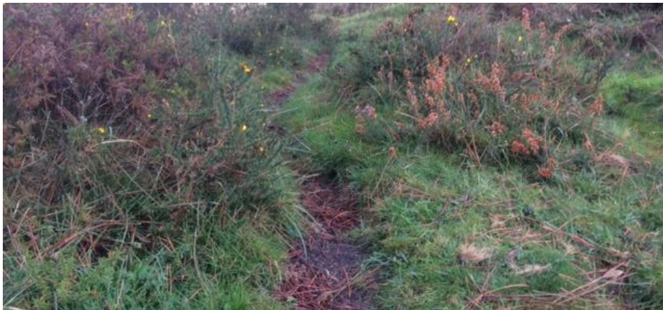
Senderos existentes, no representados en mapa, y que evitan la afección de vegetación

IOC Caminos, sendas y carreiros existentes. Los participantes emplearán, siempre que sea posible, los caminos, sendas y carreiros representados en el mapa. También aprovecharemos durante la carrera la extensa malla de senderos existentes entre la vegetación, creados por el tránsito permanente del ganado vacuno y caballar. Esta densa malla no está representada en el mapa, porque la escala de impresión, mayoritariamente 1:10000, no lo permite.