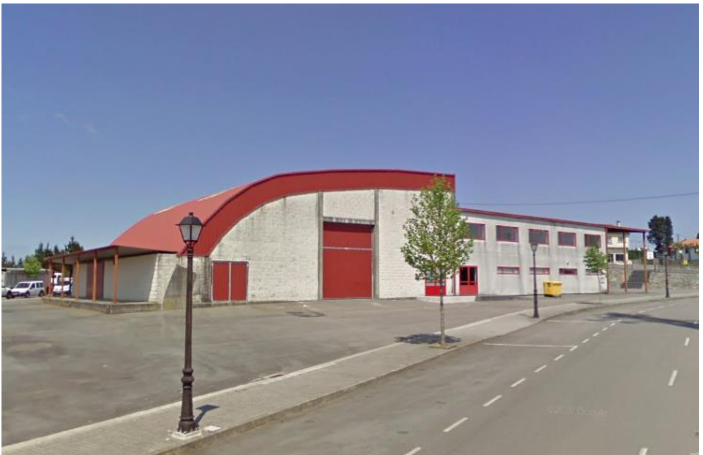
Campo Da Festa Do Lacon Con Grelos

Este recinto será nuestro Centro de Competición. Aquí se ubicará la recepción y la secretaria. Y de aquí partirán los balizados a las diferentes zonas de salida y llegarán los corredores a meta.