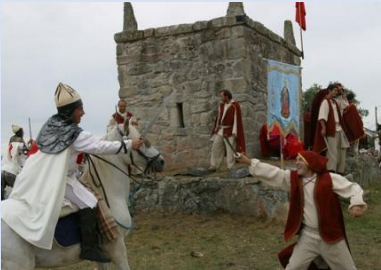
Batalla de Mouros e Cristiáns na Romería da Saínza

Recordamos que o Concello de Rairiz de Veiga está englobado na Reserva da Biosfera Área de Rairiz e parte da zona de competición esta dentro das Veigas de Ponte Liñares (Rede Natura 2000) e a súa vez é zona ZEPA (Zona Especial de Protección de Aves) polo que, aínda que o deporte de orientación caracterízase por ser un deporte "verde", maximizaremos o respecto polo medio ambiente durante a proba.