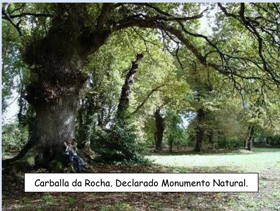
Carballa da Rocha. Declarado Monumento Natural.

Indicar no concepto: ORI-SAÍNZA+Nome do clube (ou participante non federado).