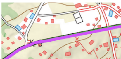
Estrada proibida (proibido cruzar ou transitar)

Tamén haberá outro cruce sinalizado co símbolo de semáforo . Teredes un pulsador en dito semáforo que teredes que pulsar i esperar a que estea en verde antes de cruzar a estrada.