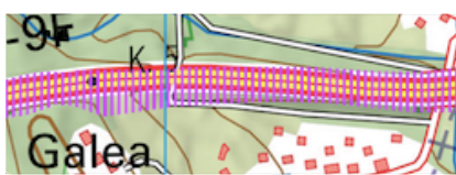
Estrada proibida (proibido cruzar ou transitar)