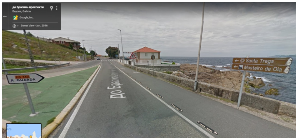
Final da AG-57, dirección Oia, A Guarda.