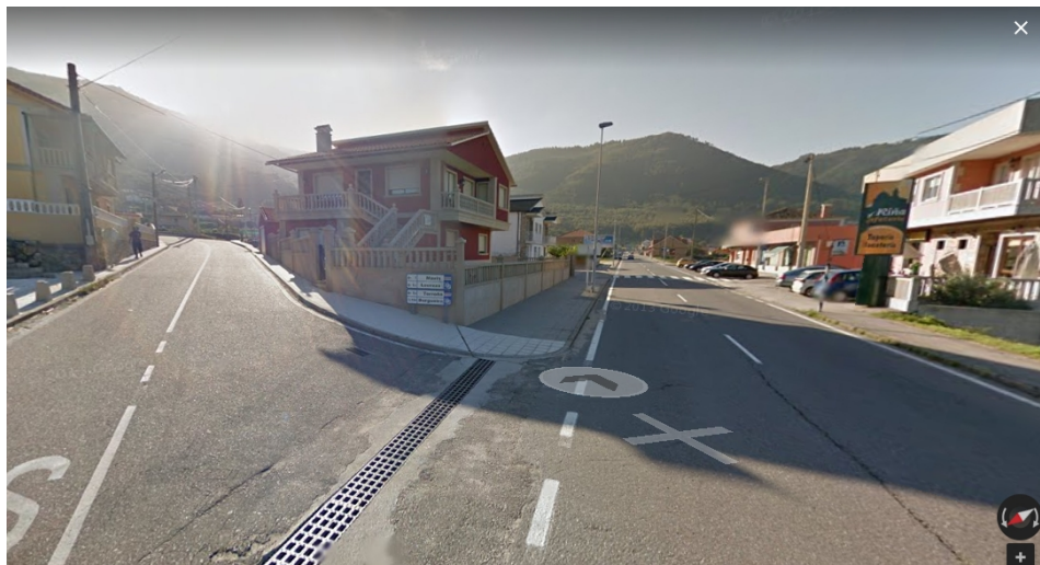
Cruce en Oia dirección Loureza, Torroña, Burgueira.