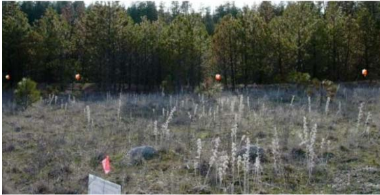
Exemplo de vista dende o punto de decisión