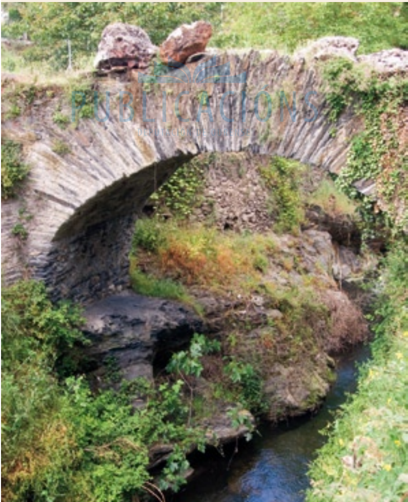
Ponte de orixe romana en Entoma