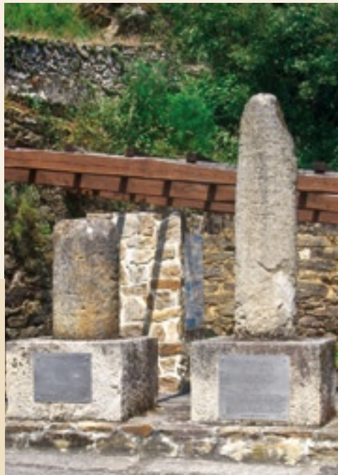
Millarios na Vía Nova