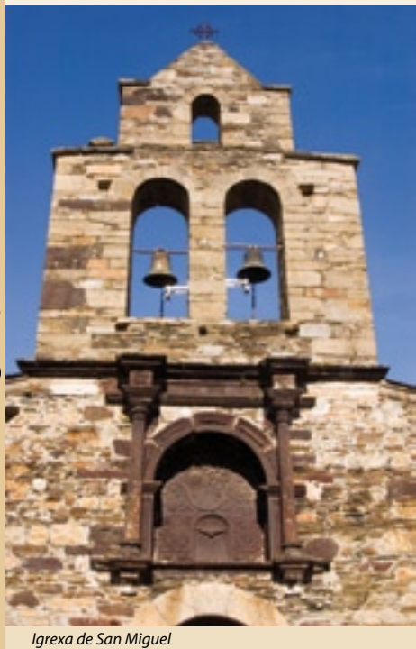
Igrexa de San Miguel

O Camiño Francés é o que tradicionalmente seguiron os cristiáns para peregrinar ata Santiago de Compostela. Pero nin foi o primeiro, nin o único. O primeiro discorria pola cornixa cantábrica, para evitar os riscos das zonas aínda ocupadas polos musulmáns, e coa máis importante das rutas confluían outras que se converteron en camiños secundarios e alternativos ante determinadas circunstancias meteorolóxicas ou doutro tipo.