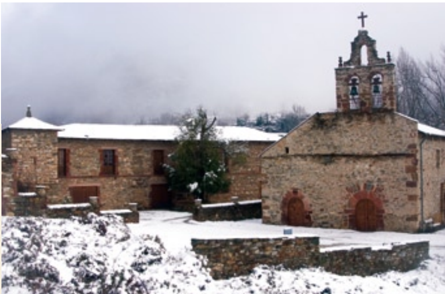
Igrexa e mosteiro de Xagoaza

A construción do mosteiro está datada no século XVIII. O edificio, que impressiona pola súa beleza e simplicidade, está realizado en pedra e artículase, en forma de U, ao redor dun claustro interior rectangular. A este patio, e tamén ao mosteiro, accédese por un grande portalón, dende o que pode verse a galería de madeira situada no primeiro piso do edificio, arredor de todo o claustro. Na planta baixa da construción sitúase unha moderna adega vitivinícola, os viñedos da cal se atopan situados tamén no ámbito do conxunto monumental.