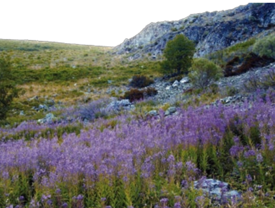
Comezo da primavera no macizo

O Macizo de Trevinca ten un clima excepcionalmente duro, con fortes nevadas en inverno, que ás veces se prolongan nos cumios ata ben entrada a primavera. Os altos nevados nutren regueiros, afluentes e ríos situados en todas as vertentes da serra, como o Xil, o Xares ou o Bibei. Nos cumios hai varias lagoas, de augas