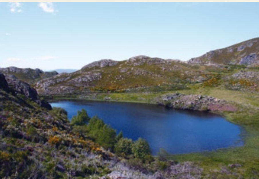
Lagoa de Ocelo

Trátase dun camiño circular que percorrería territorios de varios concellos, de Ourense e Zamora: A Veiga, Carballeda, Viana e Petín, en Galicia, e Porto e Pías, en Castilla-León. Ademais, tamén están previstos varios sendeiros de pequeno percorrido (PR).