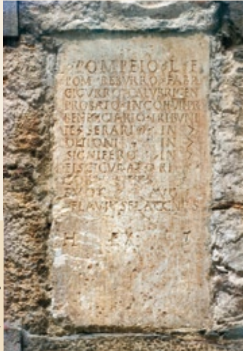
Lápida da Cigarrosa