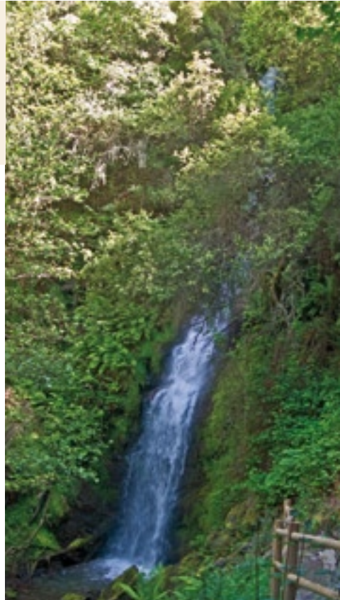
Pincheira de Fervenza

A “Pincheira” de Fervenza é un enclave natural que ninguén debe perderse, pola beleza case salvaxe do lugar. Trátase dunha fervenza situada a poucos metros da poboación de Fervenza. Pode chegar-se en coche case ata a mesma fervenza. A auga cae con forza dende case trinta metros de altura a unha lagoa natural dende a que segue o seu curso. Varandas de madeira, mesas e cadeiras agrúpanse nun amplo espazo dende o que tamén pode verse unha panorámica espectacular do Val do Sil. Trátase dunha das moitas fervenzas naturais que hai na zona, pero quizais é unha das máis impresionantes e, ao mesmo tempo, máis doada de visitar polo cómodo acceso e a proximidade ao Barco.