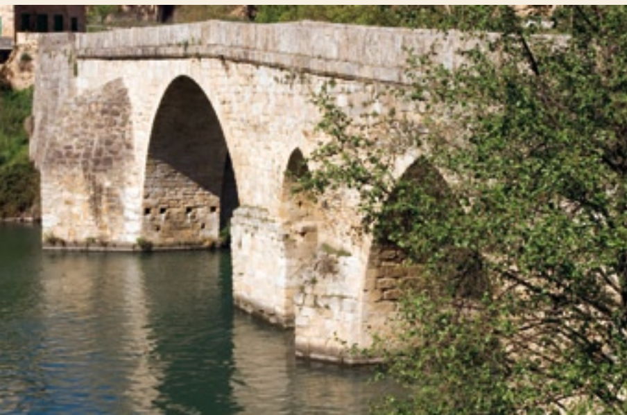
Ponte da Cigarrosa

A Vía Nova destaca das restantes vías por unha serie de singularidades que fortalecen a súa importancia histórica e patrimonial, xa que conserva un grande número de fitos miliarios elaborados en grandes bloques cilíndricos de granito, destinados, ao igual que os nosos indicadores quilométricos de estradas, a orientar e informar o camiñante á vez que facían de panfletos propagandísticos da figura do emperador reinante. Posúe numerosas pontes en bo estado de conservación, algunhas delas en uso como a Ponte Bibei e outras que conservan grande parte da súa fábrica orixinal romana como a ponte da Cigarrosa; consérvanse grandes tramos da calzada que permiten coñecer a técnica construtiva empregada polos enxeñeiros romanos e destaca o desexo destes por trazar