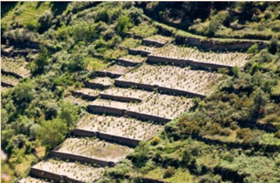
Viñas en socalcos nos Codos de Larouco

Durante o noso percorrido pola Vía Nova en Valdeorras atoparémolos con importantes restos arqueolóxicos e fundamentalmente con mostras palpables do paso desta importante ruta por este territorio: como pontes, construcións máis destacables pola gran monumentalidade e beleza. Unha delas, a Ponte Bibeí, é unha das obras romanas máis importantes que se conservan en España, declarada Monumento Histórico Artístico no ano 1931, posto que mantén practicamente a súa factura orixinaria despois de dous mil anos.