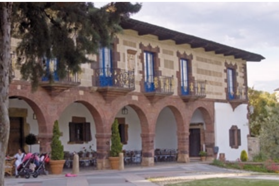
Pazo dos Flórez

Ademais, no Castro recuperáronse moitas vivendas tradicionais, tanto para uso particular coma para negocios de hosta-