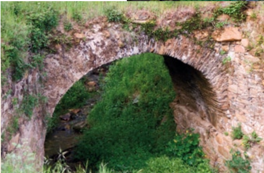
Ponte de orixe romana do Corrego

No concello do Barco atópanse varias pontes de orixe romana. O máis relevante, e quizais o que mellor pode verse atópase na localidade de Éntoma. Situada sobre o río Galir, crese que esta ponte era parte dunha das vías secundarias