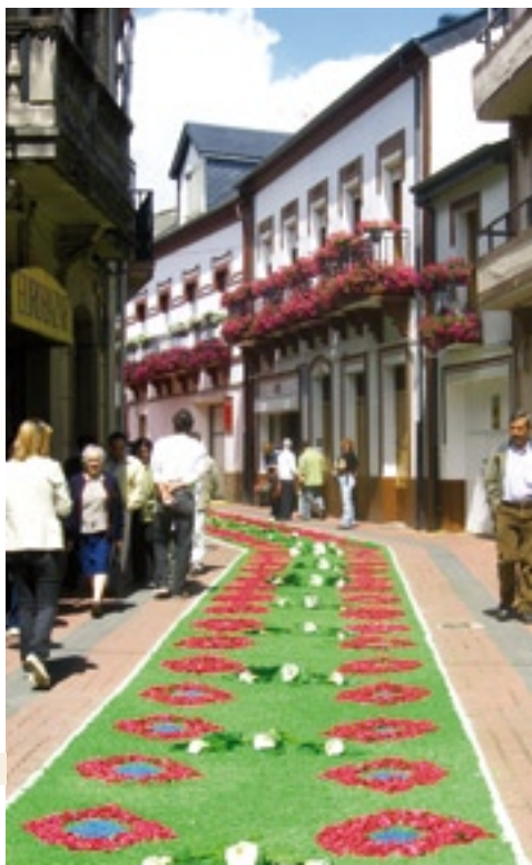
Alfombras florais do Corpus no casco vello