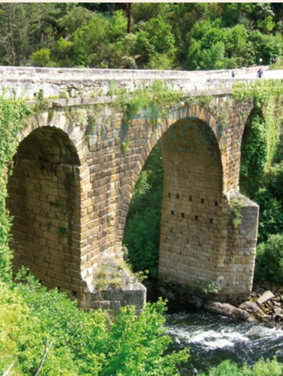
Ponte do Bibei

metros de lonxitude e 22,5 metros de altura; deseñada para salvar o profundo val do río Bibei por medio de dous grandes e estilizados piares de planta rectangular rematados por tallamares triangulares, augas arriba, para minimizar o pulo das embravecidas augas do río.