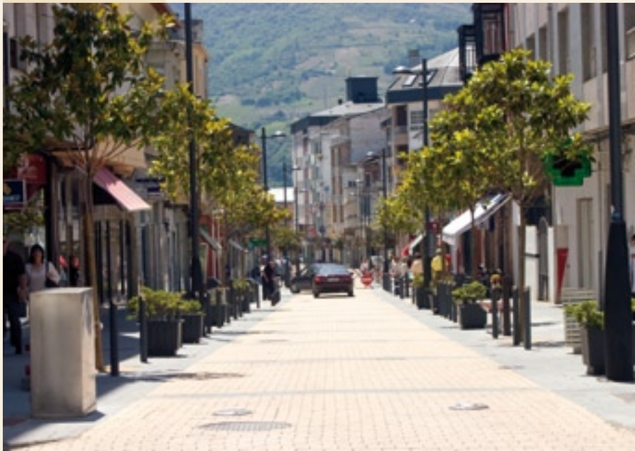
Zona urbana da Rúa

Na Ribeira Sacra, o Camiño de Inverno ten unha lonxitude de 100 quilómetros ata que se interna na Bisbarra do Deza, na provincia de Pontevedra. Alí, será necesario percorrer outros 42 quilómetros máis, os que quedan ata Lalín, onde se enlaza coa Ruta da Prata para, finalmente, chegar a Santiago, uns 57 quilómetros máis tarde.