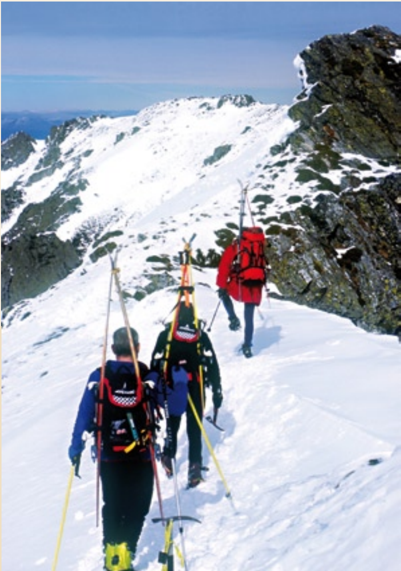
Montañeiros ascendendo a Pena Trevinca con neve

ao desnivel existente entre as cotas máis baixas e as que están máis elevadas. Nesta serra conviven especies de flora e fauna moi escasas noutras zonas de Galicia, e consérvanse hábitat únicos: uceiras, prados ibéricos, desprendementos mediterráneos occidentais e termófilos, pendentes rochosas silíceas, bosques aluviais, de carballos, castiñeiros, acivros