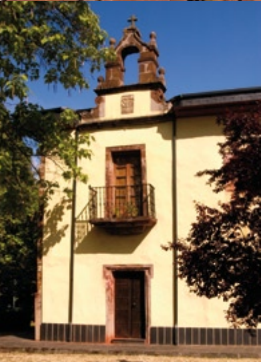
Igrexa e Casa Grande de Viloira