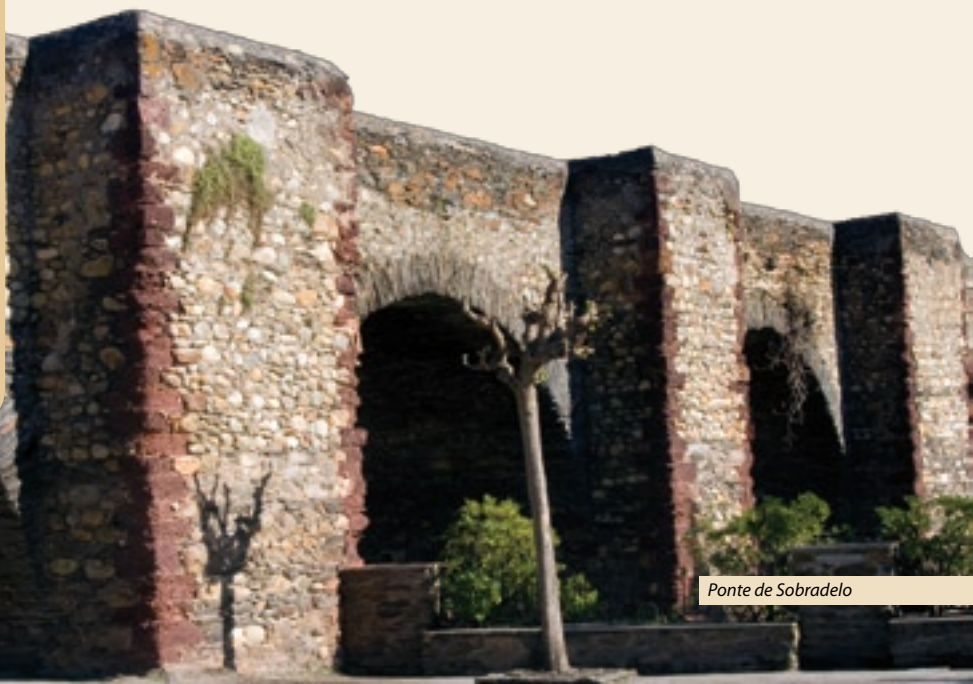
Ponte de Sobrado

É o caso do Camiño de Inverno a Santiago, que parte do Camiño Francés en Ponferrada e, para evitar a dura ascensión por Pedrafita –sobre todo en inverno–, chega ata Santiago despois de cruzar O Bierzo polo Sur, Valdeorras, a Ribeira Sacra, a Bisbarra do Deza e, finalmente, tras enlazar coa Ruta da Prata en Lalín, chegar á capital de Galicia. Este camiño é moi antigo, e demostrouse, con documentación, que era moi utilizado por peregrinos que