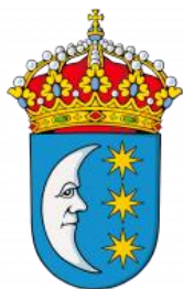
CONCELLO DE TUI

Na organización do 7º BUDIÑORAID 2022, Xunto co clube organizador, o Budiñoraid, colaboran as seguintes Administracións :