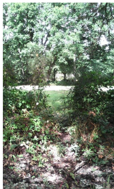
Exemplo de sebe representada como límite de cultivo (415)