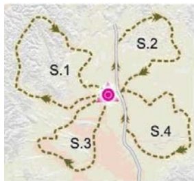
TRAZADO EN ESTRELLA