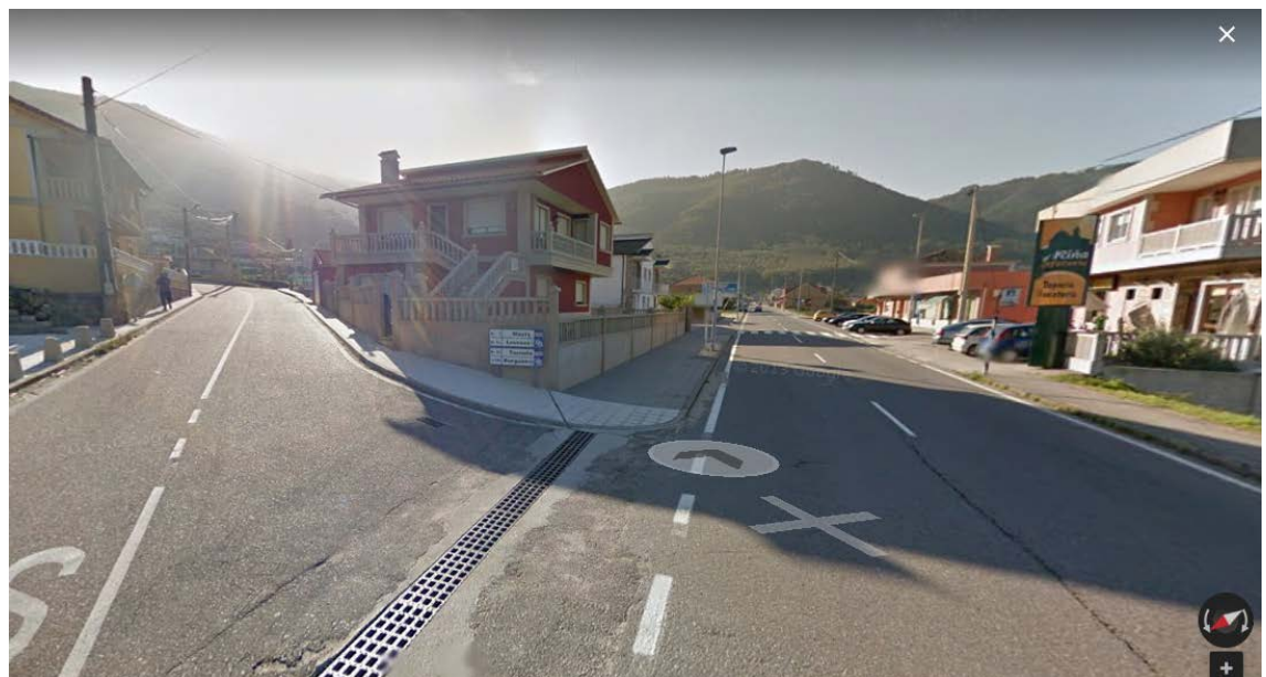
Cruce en Oia dirección Loureza, Torroña, Brugueira.