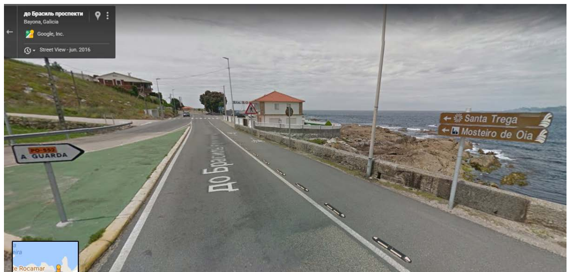
Final da AG-57, dirección Oia, A Guarda.