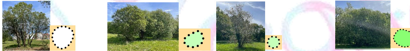
405 "Bosque limpo"