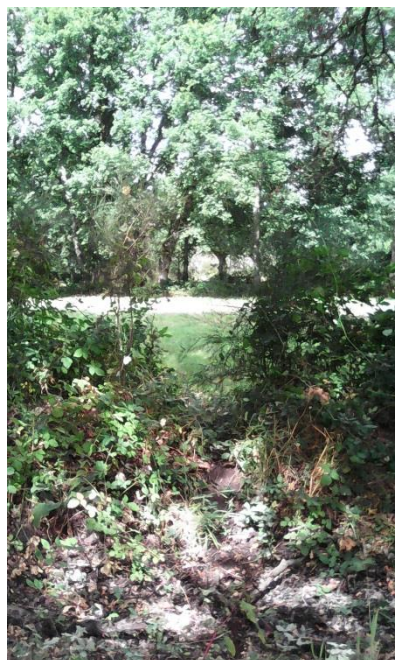
Exemplo de sebe representada como límite de cultivo (415)