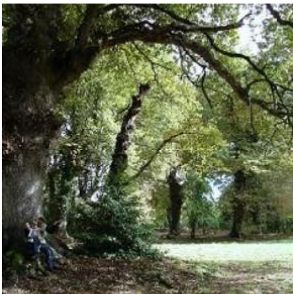
Carballa da Rocha. Declarado Monumento Natural.

Enviar xustificante do ingreso a: ori.limiactiva@gmail.com