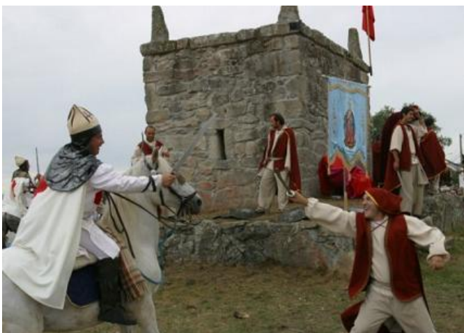
Batalla de Mouros e Cristiáns na Romería da Saínza

Recordamos que o Concello de Rairiz de Veiga está englobado na Reserva da Biosfera Área de Rairiz e parte da zona de competición esta dentro das Veigas de Ponte Liñares (Rede Natura 2000) e a súa vez é zona ZEPA (Zona Especial de Protección de Aves) polo que, aínda que o deporte de orientación caracterízase por ser un deporte "verde", maximizaremos o respecto polo medio ambiente durante a proba. Non se deberán sacar as botellas fora das zonas de avituallamiento.