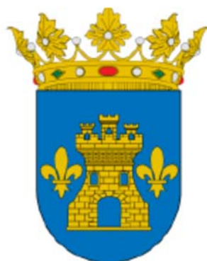
Concello de ABADÍN