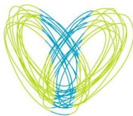
EUROCIDADE VALENÇA .TUI