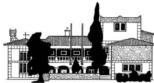
FACULTADE DE CIENCIAS DO DEPORTE E A EDUCACIÓN FÍSICA