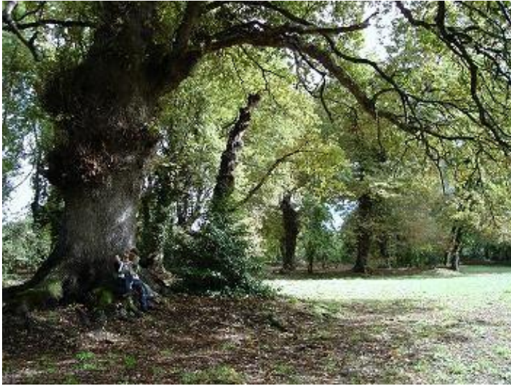
Carballa da Rocha. Declarado Monumento Natural.